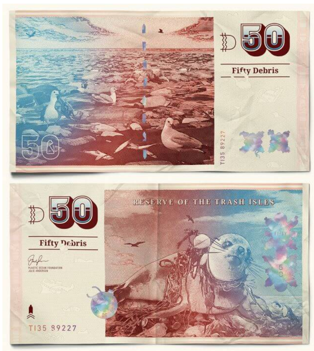
שטר של 50 דברים